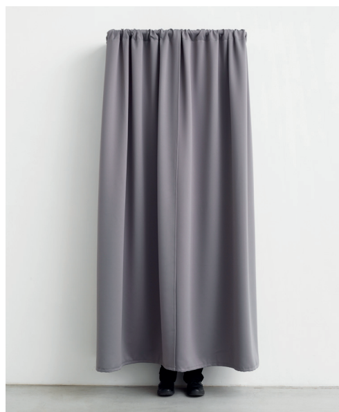
Peter Land, I'm NOT Here , 2013