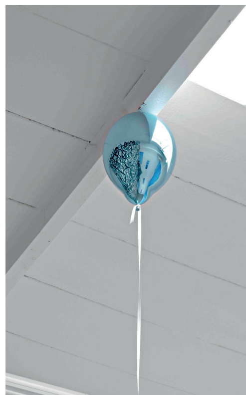
Jeppe Hein, Blue Mirror Balloon (light) , 2017, installation

Find et overordnet tema for værket. Hvad er fællesnævneren for det modsætningspar, som kunstværket opstiller, og som objekterne eksemplificerer?