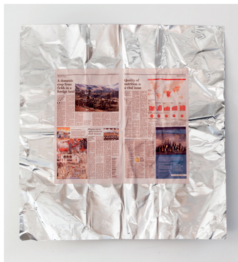
Tue Greenfort, A Domestic Crop from fields in a foreign land , (2010), 2014

Funders øre fungerer til sammenligning som en startmarkør til de fortællinger, der gemmer sig under udstillingens blankpolerede kunstobjekters overflade. For dykker man ned i værkerne og ser bag om deres ydre, vil man opdage et utal af meningsfulde emner, som på forskellige måder relaterer sig til den tid og det samfund, vi alle er en del af.