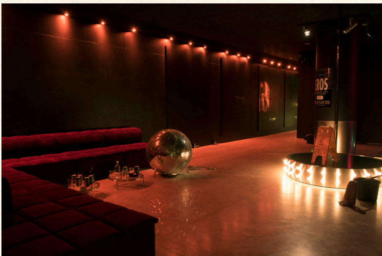
Too late, Michael Elmgreen & Ingar Dragset, 2008. Placering: niv. 0

? Forestil dig, at du er fluen på væggen til festen: Hvad oplever I: kl. 22.30 - kl. 00.00 - kl. 03.30 - kl. 06.30?