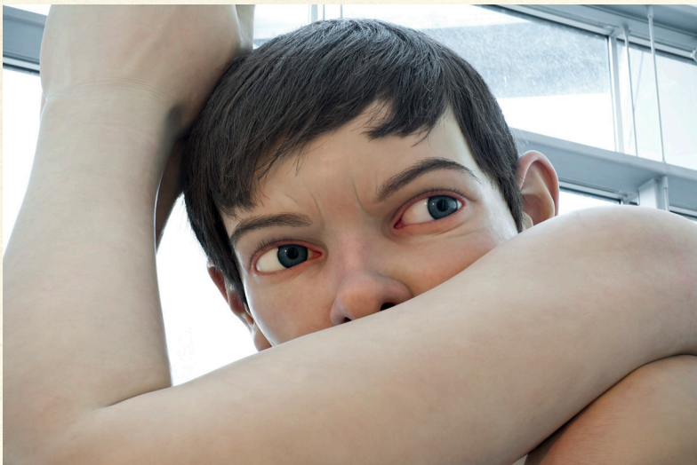
Boy, Ron Mueck, 1999.