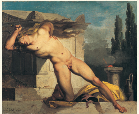
Adrastos dræber sig selv ved Atys' grav, 1774-76, Nicolai Abraham Abildgaard. Placering: niv. 8