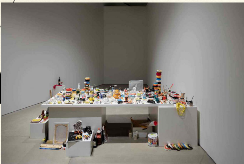
Tableau, Rose Eken, 2015. Placering: niv. 6

! Rose Eken er en af en af de kunstnere, der vedholdende skaber sine kunstværker med egne hænder. De fleste samtidskunstnere skaber ikke altid selv deres værker med egne hænder, men har rollen som den, der udtænker projektet, mens assistenter og moderne produktionsmetoder reelt set er dem, der udfører det fysiske dele af et givent kunstprojekt.