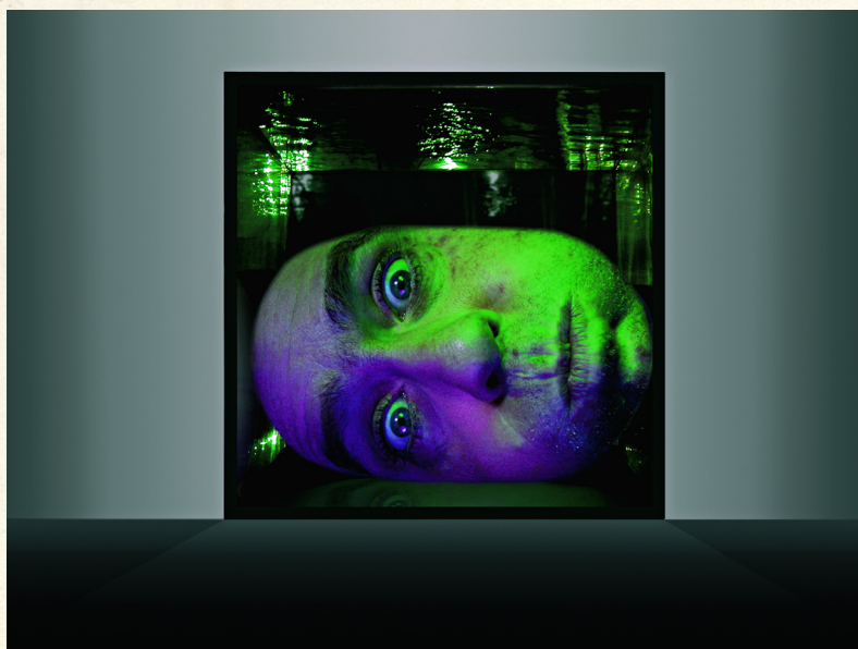
Unk, Tony Oursler, 2004 Placering: niv. 0

I museets nederste etage udstilles en række installationskunstværker. Efterhånden som man bevæger sig igennem udstillingsområdets mørke, smalle gange høres nogle underfundige lyde, og pludselig står man foran rummet med en solid glastank fyldt med vand. I vandet ligger et stort hoved og mumler. Ansigtet i glastanken forestiller kunstnerens eget ansigt, og "Unk" er derfor en moderne form for selvportræt med indbygget lyd.