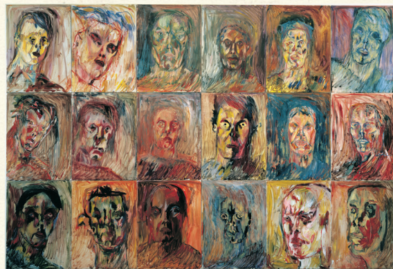
18 portrætter, Svend Wiig Hansen, 1989. Placering: niv. 6

! Wiig Hansens kunst handler typisk om mennesket og dets sind, om dets angst, ensomhed og fortvivlelse. Men hans værker handler også om menneskets energi og dets evne til at klamre sig til livet, når verdenen bliver for ond.