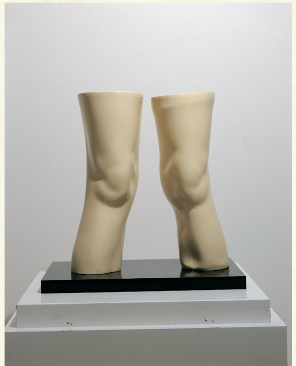
London Knees, Claes Oldenburg, 1966. Placering: niv. 8

Forestil dig, at du er Oldenburgs kvinde med knæene i 1960'ernes London. Lev dig ind i kvindens liv og skriv et kort dagbogsnotat på hendes vegne.