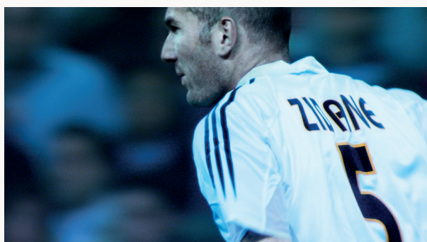
Douglas Gordon & Philippe Parreno Zidane: A 21st Century Portrait, 2006

Filmen følger den franske fodboldspiller Zinedine Zidane i realtid hen over én enkelt kamp, som fandt sted i 2005. Filmen, der består af forskellige optagelser foretaget af 17 kameraer rundt omkring på stadion, fanger Zidane fra flere vinkler. Vi ser ham både på tæt hold og langt væk, og fastholder hele opmærksomheden på ham – også når kampens fokus bevæger sig andre steder hen. Fokus er på manden snarere end på bolden.