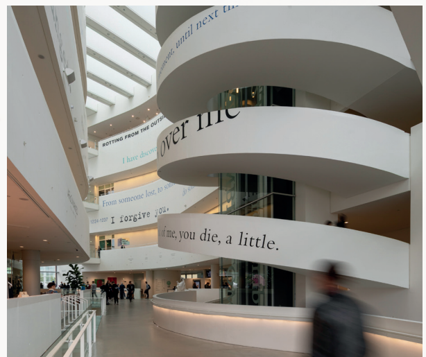
Installation view. Douglas Gordon: In My Shadow, ARoS, 2019.

I hele udstillingsperioden er ARoS på alle etager udsmykket med Gordons tekstværker, der leger med de forskellige betydningsslag, en tekst kan have. Læseren, stedet og sammenhængen vil altid tilføje nye betydninger til de skrevne ord. De forskellige tekster og deres stil stammer fra forskellige steder fra – nogle udsagn er universelle, mens andre er personlige. Nogle har en retorisk eller bibelsk tone, mens andre henvender sig direkte til os ved at bruge 'I', 'jer' eller 'vi'. Værket viser Gordons fascination af sprog og særligt de splittede og modsatrettede betydninger, der kan opstå, alt efter hvor og hvordan en tekst står skrevet, og hvem der læser den. Nogle af teksterne er spejlvendte, som også er et af de greb, kunstneren bruger filmisk for at markere, at noget har en dobbelt betydning.