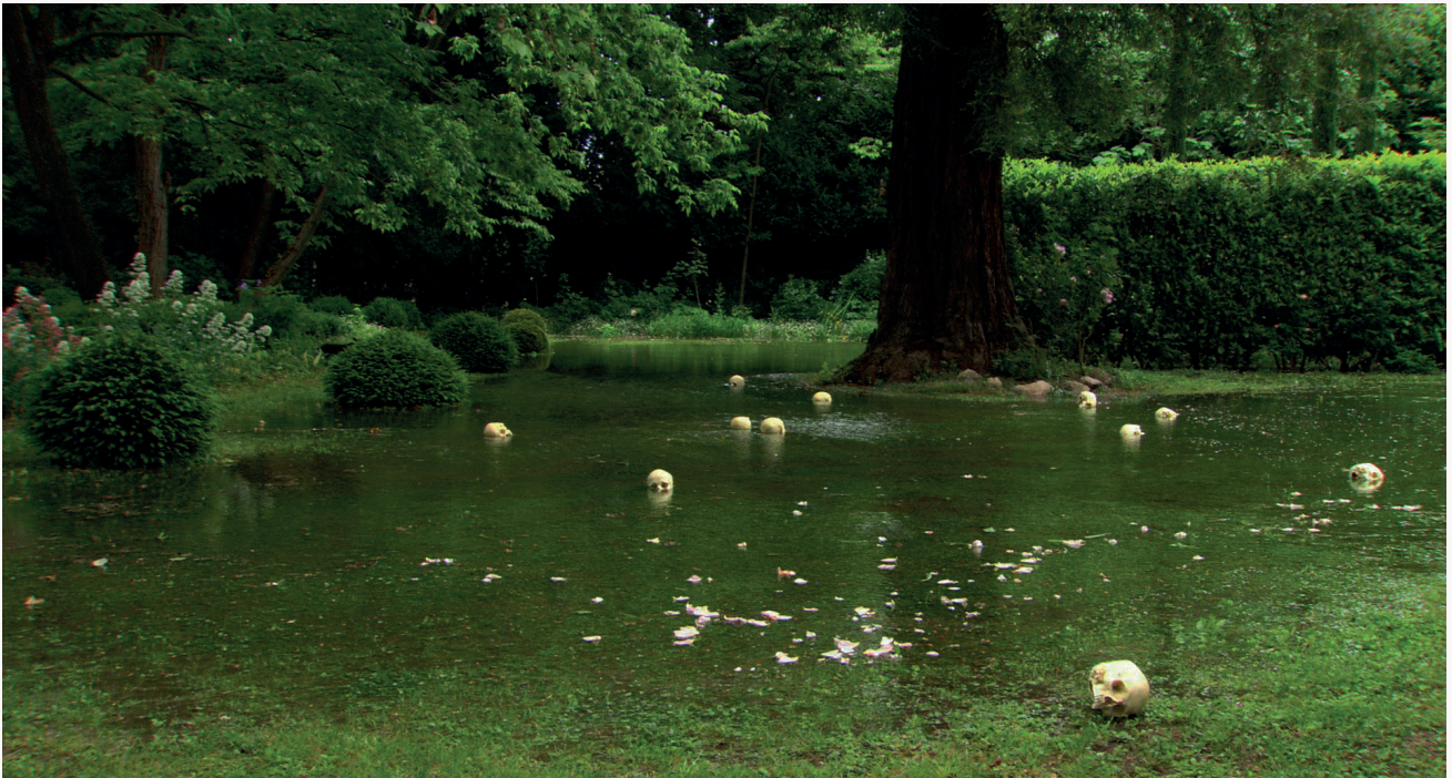
Douglas Gordon, Îles flottantes, (If Monet Met Cézanne, in Montfavet), 2008. Video Installation. Dimensions variable.

I værket Îles flottantes viser den ene skærm et langvarigt forløb, hvor en smuk have i Sydfrankrig er overstrøet med menneskelige kranier, som gradvist oversvømmes med vand. Den anden viser en kortere sekvens, hvor vi ser kranierne i nærbillede, mens de flyder på vandet. Alle optagelserne er filmet under kunstnerens ophold ved Yvon Lambert i Montfavet, tæt på Avignon, Frankrig.