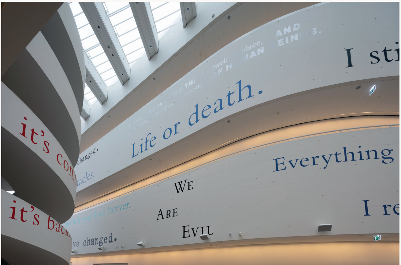
Installation view. Douglas Gordon: In My Shadow , ARoS, 2019. Anders Sune Berg.

pretty much every word written, spoken, heard, overheard from 1989..., 2006