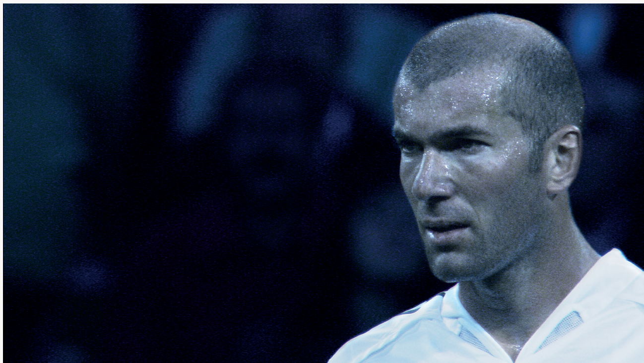
Douglas Gordon & Philippe Parreno Zidane: A 21st Century Portrait, 2006 Courtesy Studio lost but found, Berlin; Studio Philippe Parreno, Paris; Anna Lena Films, Paris.