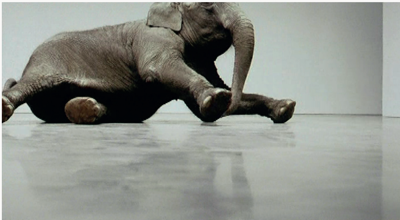
Douglas Gordon Play Dead; Real Time , 2003. Multi channel video installation without sound. Dimensions variable.

I værket Play Dead viser to skærme, hvordan en elefant langsomt lægger sig ned på gulvet. Det gør den flere gange. Ideen til værket fik kunstneren, da han kom til at tænke på, om han nogensinde havde set en elefant lægge sig ned, hvorefter han fik en asiatisk hunelefant bragt til sit galleri i New York. Elefanter er af natur ikke meget for at lægge sig ned, modsat mennesker, men Gordon fik elefantpasseren til at få elefanten til at lægge sig ned, ”play dead”, og rulle omkring for at skildre dyret i en situation, det ikke naturligt befinder sig i, og fra vinkler man normalt ikke ser. Man kan se, at elefanten ikke er komfortabel med at ligge ned. Hos Gordon har filmmediet her den egenskab, at det med nærbillederne og kameraføringen fremhæver en sensibilitet og en ømhed, der ellers ikke er til stede i selve handlingen, og som ved nærmere eftertanke er på kanten til et overgreb.