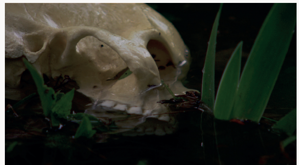
Douglas Gordon, Îles flottantes, (If Monet Met Cézanne, in Montfavet), 2008. Video Installation. Dimensions variable.