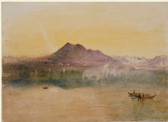
Joseph Mallord William Turner, The Dark Rigi: Sample Study. c.1841-2 Watercolour on paper. Accepted by the nation as part of the Turner Bequest 1856.

nyeste teorier om farve og lys. Som maler insisterede Turner på at skildre lysets sublim kraft, dets stemningsskabende effekt og indvirkning på det sete, naturen og omgivelserne. 'Solen er Gud' var efter sigende hans allersidste ord, og som motiv indtog solen utvivlsomt en central position i hans billeder. Men hvad Turner helt nøjagtigt har ment, finder vi jo aldrig ud af. Nogle forskere har endog fortolket hans solbilleder som selvportrætter. De mener, at ordene knyttede sig til Turners religiøse overbevisning eller forestilling om en højere sandhed af mere universel og åndelig karakter, hvor solen, særligt i lyset af romantikkens geni-tænkning, står som symbol for menneskets egen guddommelige skaberevne og kreativitet – og dermed som et billede på Turners egen skaberevne som kunstner.