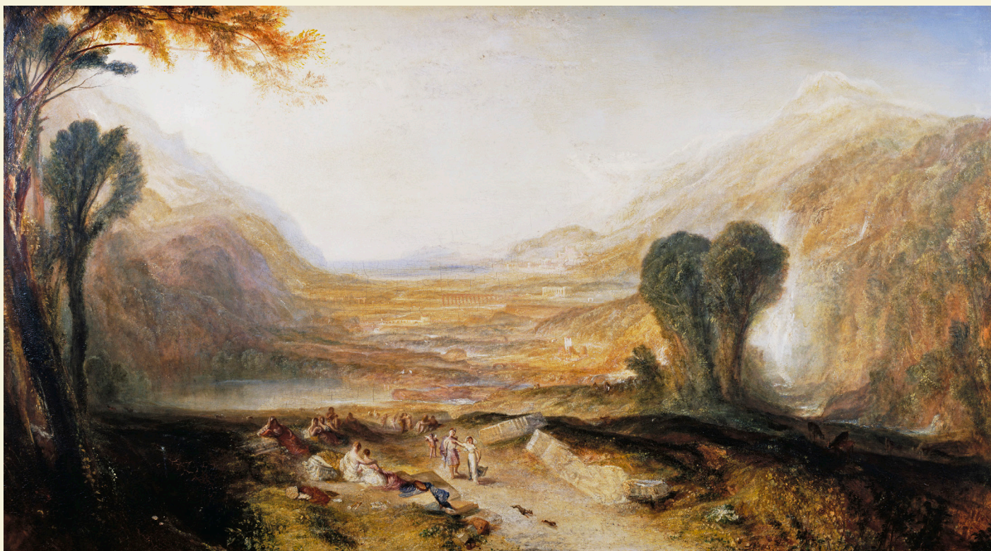
Joseph Mallord William Turner, Story of Apollo and Daphne , exhibited 1837. Oil paint on canvas. Accepted by the nation as part of the Turner Bequest 1856.

De fem lysfyldte malerier, der præsenteres i dette centrale rum på udstillingen, har alle solen som hovedmotiv og er skabt i Turners sene karriere. Motiverne af solens glødende og livgivende stråler vidner om Turners dybe indsigt i sin tids