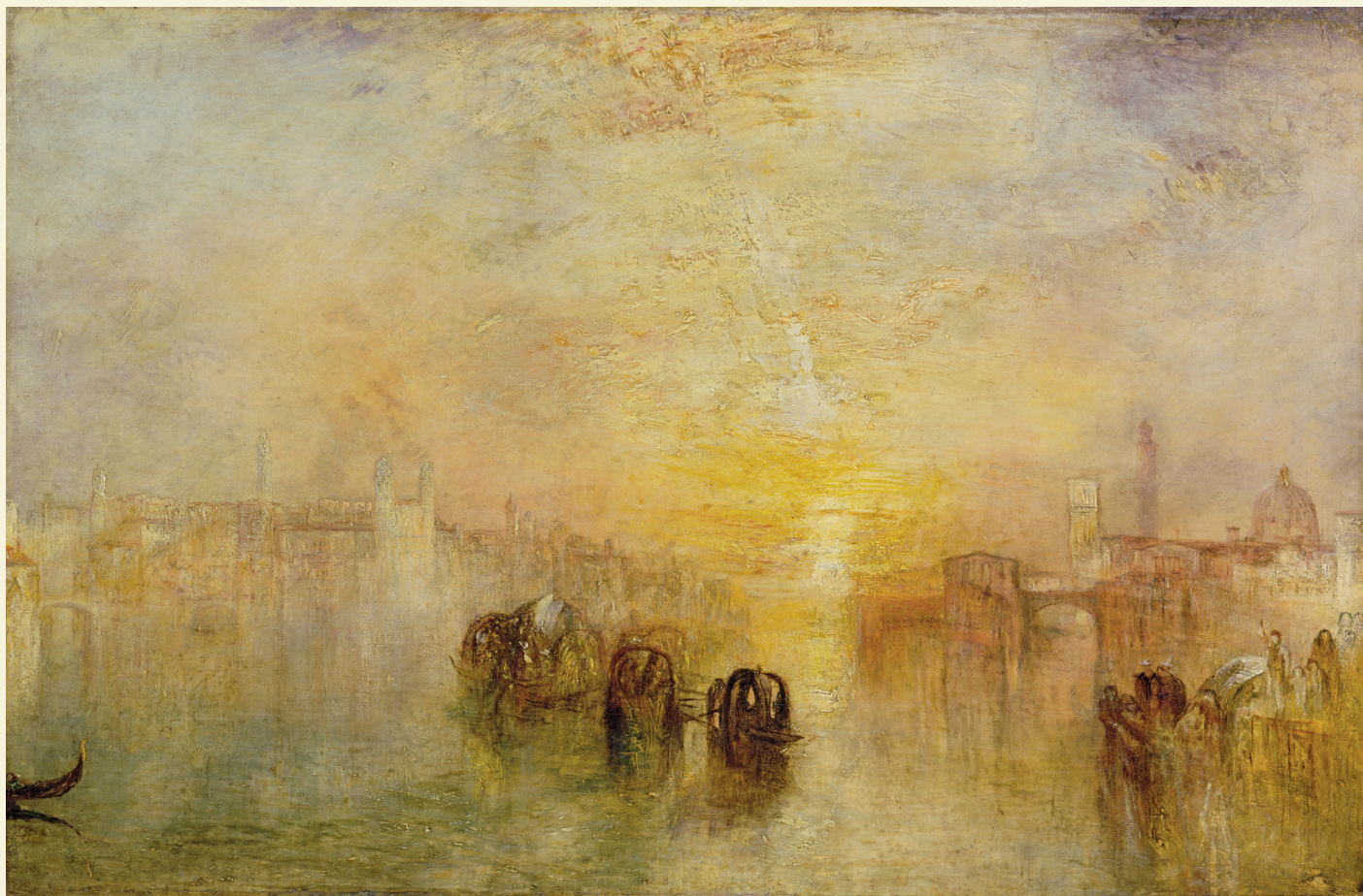
Joseph Mallord William Turner, Going to the Ball (San Marino) exhibited 1846. Oil paint on canvas. Accepted by the nation as part of the Turner Bequest 1856.

Turner levede før telefonerne og kameraets tid, hvor de fleste gjorde en dyd ud af den realistiske stil, men Turner vendte sig en anden vej og udforskede det mere abstrakte. I dag dyrker sociale medier som Instagram den perfekte æstetik, men for Turner er det det uskarpe og tågede, der skaber den unikke atmosfære. Arbejd med hvordan I selv kan skabe digitale billeder, der giver den samme fornemmelse som Turners akvareller og beskriv fordelene eller