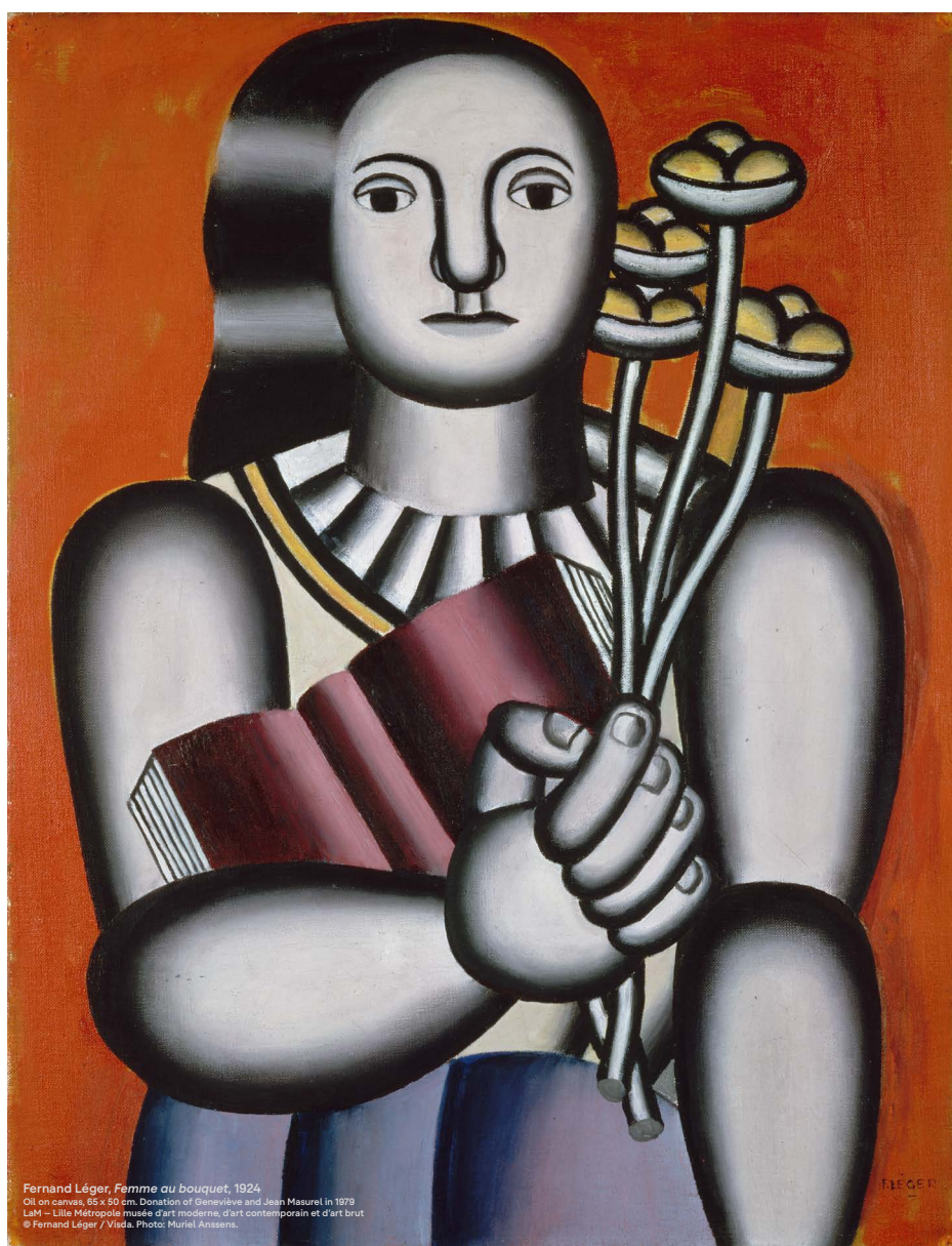
Fernand Léger, Femme au bouquet , 1924. Oil on canvas, 65 x 50 cm. Donation of Geneviève and Jean Masurel in 1979. LaM – Lille Métropole musée d'art moderne, d'art contemporain et d'art brut © Fernand Léger / Visa.

LaM Lille Métropole Musée d'art moderne, d'art contemporain et d'art brut Udstillingen er udarbejdet i samarbejde med LaM – Lille Métropole Musée d'art moderne, d'art contemporain et d'art brut, Villeneuve-d'Ascq, Frankrig.