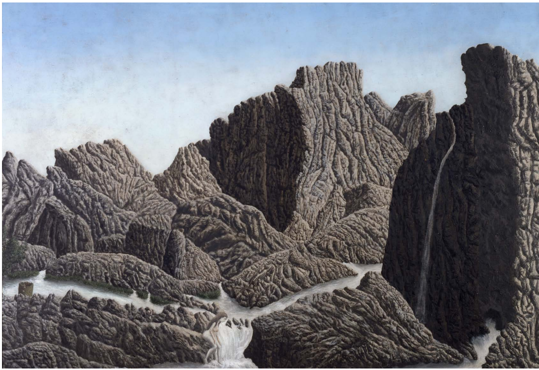
André Bauchant (1874 – 1958, FR), Le Styx , 1939.olie på lærred 97 x 142 cm. Inv. 979.4.7 LaM - Lille Métropole Musée d'art moderne, d'art contemporain et d'art brut © André Bauchant / VISDA 2025